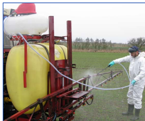
Obr. 2 Umístění QCK na postřikovači