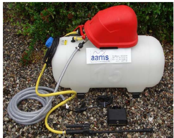
Obr. 1 Quick Cleaning Kit

Čištění začíná, jakmile je zahájeno vyprazdňování hlavní nádrže postřikovače - spuštěním samostatného čerpadla z kabiny traktoru. Čistá voda s/bez (dle požadavku etikety POR) čistícího prostředku je vedena do nádrže proplachovou tryskou/tryskami k oplachu vnitřku nádrže, zatímco hlavní čerpadlo pokračuje v dopravě rozředěné postřikové kapaliny do trysek. Všechny ventily jsou během čištění otevřeny a všechny hadice jsou zaplněny. Nedochozí k recirkulaci čištěné oplachové vody a hlavní čerpadlo je důkladně vyčištěno stejně jako nádrž.